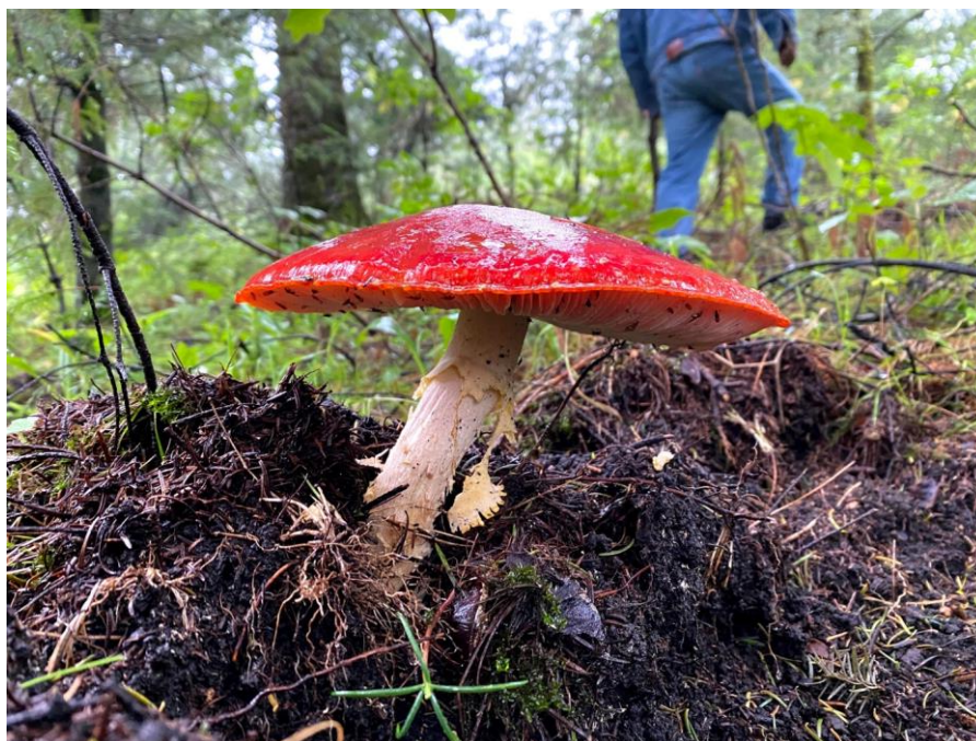
Figura 5. Hongo tóxico conocido como “Matamoscas” durante el recorrido con un honguero de la comunidad de Santa Rosa Xochiac.

ejecutaban principalmente mujeres que iban a recoger algunas ramas o sobrantes a los aserraderos y la llevaban al pueblo para vender como carbón. Como comenta una de la entrevistadas: ‘nada se desperdiciaba’ La tarea de recolección se llevaba a cabo por medio del mecapalli , que consiste en una banda de algodón o de ixtle -fibra del maguey-, sujeta por sus extremos a dos cuerdas que sirven para sostener la carga. La banda protegía la cabeza y el cuello, y al mismo tiempo hacía que la carga se equilibrara y distribuyendo el peso por todos los músculos del cuerpo del cargador. Las prácticas de recolección se organizaron a manera de paquete junto con las de recolección de hierbas medicinales y hongos ya que, durante el trayecto, las leñeras recopilaban plantas y hongos para vender. Esta co-dependencia a la proximidad del aserradero creó un lazo mucho más fuerte con la práctica de recolección de leña, que con la de la recolección de hongos que se continúa realizándose hasta la fecha ya que no dependía de la proximidad del aserradero para ejecutarse (Figura 5).