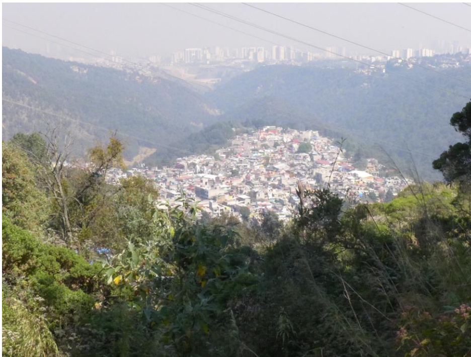
Figura 1. Vista desde el bosque al Pueblo de San Pablo Chimalpa, a lo lejos se puede observar el avance de la mancha urbana. Fotografía de la autora 26/01/2017

gentrificación, así como la discriminación de la sociedad moderna 3 . En su gran mayoría, son descendientes de sociedades indígenas hablantes de náhuatl y otomí y han tratado de mantener sus tradiciones, costumbres y fiestas que conforman un modo de vida sui generis ; así como saberes tradicionales en materia de agroecológica y organización mixta o comunal de la administración de los recursos y propiedad de la tierra.