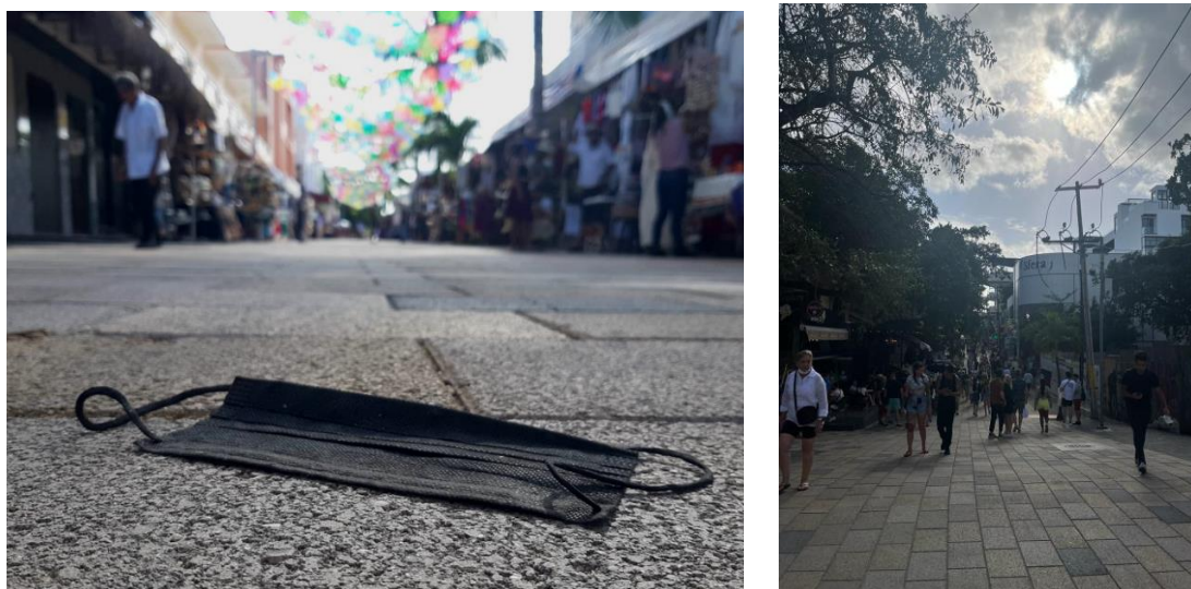
Vaciamiento de la Quinta Avenida post-Covid-19 (izquierda); reactivación del turismo en Quinta Avenida (derecha). Fuente: Xatria Manzo Herrera, enero 2022

Quintana Roo perdió 106,854 mil empleos y para febrero de 2021 aún le faltaba por recuperar 97,381 fuentes de empleo, en la parte más crítica de la pandemia de Covid-19. Los municipios de Benito Juárez (Cancún) y Solidaridad (Playa del Carmen) concentran el 91.5% del total de empleos a la baja, mientras que en el sector turístico se perdieron las 80,735 plazas, así como otras 9,259 en el de la construcción 13 . «Hoy, más que en periodos pasados, el desarrollo desigual se presenta de forma más vívida en todas las escalas sociales» (Smith, 139).