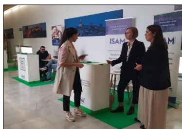
Stands de 2x2 m