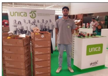
Stands de 3x3 m