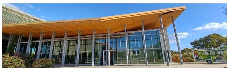
Hall del Paraninfo

*Incluye el acceso a todas las sesiones científicas durante toda la duración del Simposio (3 días), acceso a almuerzos, coffee breaks, ceremonia de apertura y visitas técnicas.