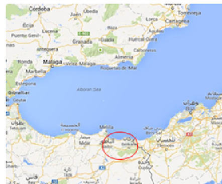
Perímetro irrigado Bajo-Moulouya.